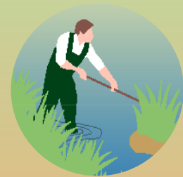
Fazer uso sustentável