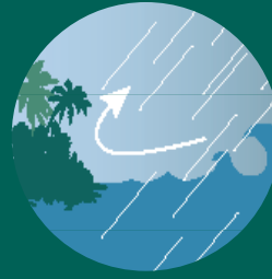
Suavizam tempestades e protegem o litoral