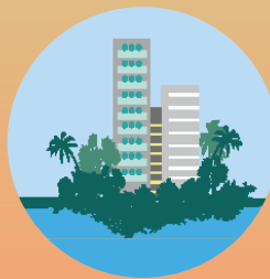
Não construir em cima